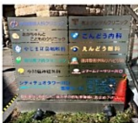
1 階 医療モール内前(2022.12 時点)