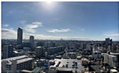
バルコニー(南側)からの眺望