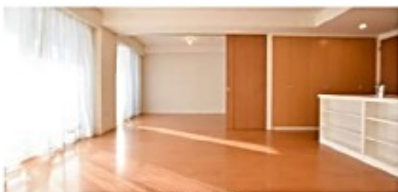
LD(洋室 3 の隣間)