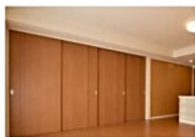
LD(洋室 3 の隣間)