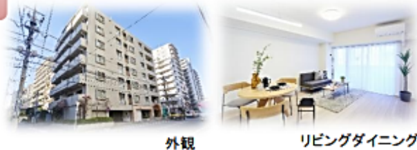
外観 リビングダイニング