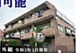
外観 令和2年2月撮影