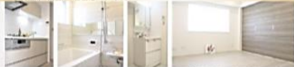
建具:ヨーロッパアンウォールナット柄 / 床:オーク柄(ベールグレー)

Natural style 淡い色のフローリングにベージュと白を基調とした 設備を導入し、どんなライフスタイルにも合う仕様。 ※洗面所の設備に一部相違があります。